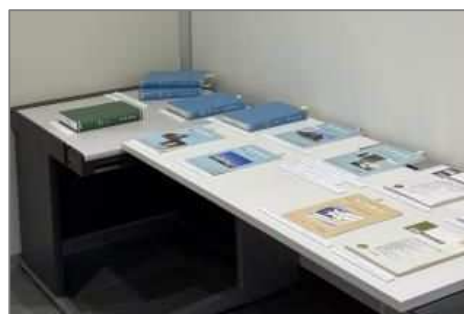
「医師国家試験特集」