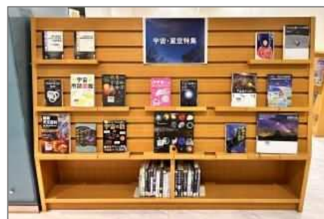
11月 宇宙・星空特集