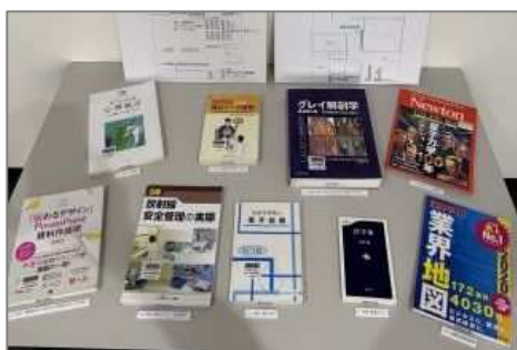
「鹿田分館の“意外”な本」