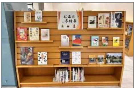
1-2月 お正月・冬特集