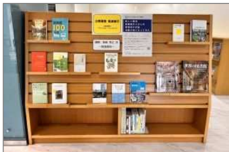
11-12月 公開講座関連展示