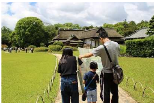
2019年度子ども向け岡山後楽園ワークショップ