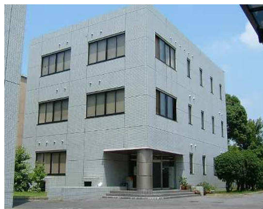
資源植物科学研究所分館

岡山大学附属図書館は、中央図書館(津島キャンパス)、鹿田分館(鹿田キャンパス)、資源植物科学研究所分館(倉敷キャンパス)の3館で構成されています。各館のサービスはそれぞれのキャンパスや大学の枠を越え、地域や他の教育・研究機関等に広く展開されています。市民に対するサービスとしては、生涯学習を直接支援する資料閲覧等のほか、藩政史料を中心とした展示会なども定着しています。