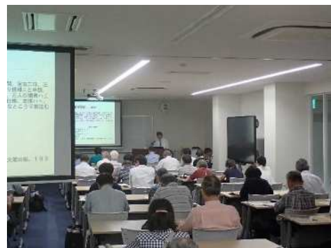
2019年度岡山大学公開講座