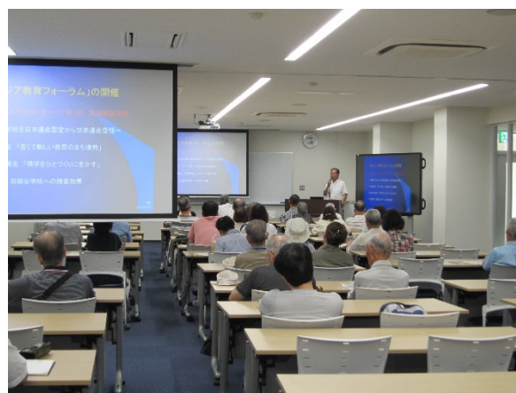
平成 30 年度岡山大学公開講座