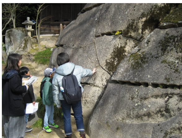
平成 30 年度子ども向け岡山後樂園ワークショップ