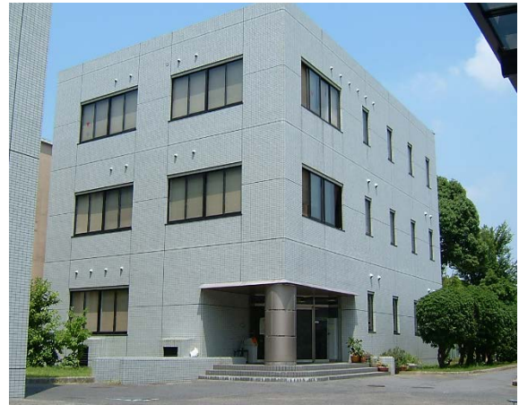
資源植物科学研究所分館

岡山大学附属図書館は、中央図書館(津島キャンパス)、鹿田分館(鹿田キャンパス)、資源植物科学研究所分館(倉敷キャンパス)の3館で構成されています。各館のサービスはそれぞれのキャンパスや大学の枠を越え、地域や他の教育・研究機関等に広く展開されています。市民に対するサービスとしては、学修を直接支援する資料閲覧等のほか、藩政史料を中心とした展示会やボランティアの受入も定着しています。