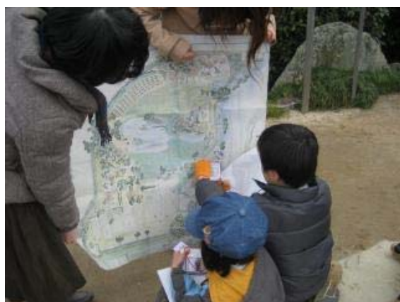
平成 25 年度子ども向け岡山後楽園ワークショップ