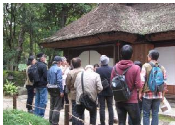
平成 25 年度池田家文庫絵図をもって岡山を歩こう