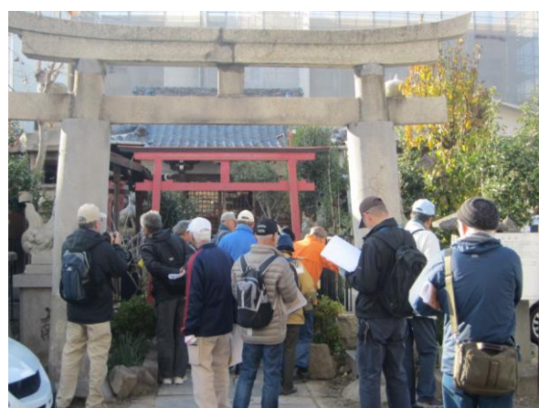
平成 24 年度池田家文庫絵図をもって岡山を歩こう