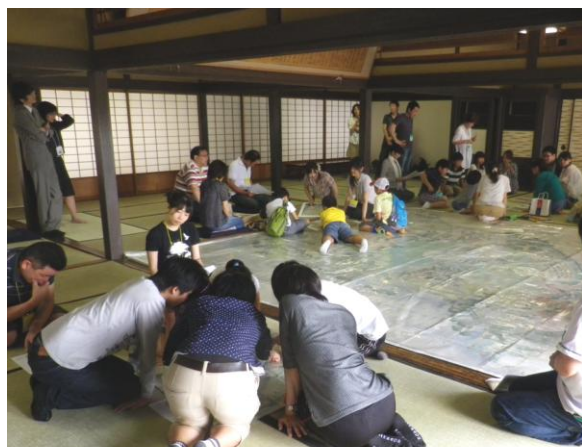
平成 24 年度子ども向け岡山後樂園ワークショップ

ワークショップと公開講座の取組みに対して国立大学図書館協会から協会賞をいただきました（平成 21 年）