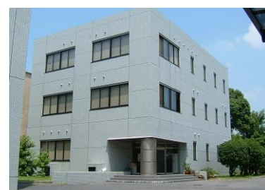
資源植物科学研究所分館

岡山大学附属図書館は、中央図書館(岡山市津島地区)、鹿田分館(鹿田地区)、資源植物科学研究所分館(倉敷市)の3館で構成されています。各館のサービスはそれぞれのキャンパスや大学の枠を越え、地域や他の教育・研究機関等に広く展開されています。市民に対するサービスとしては、学習を直接支援する資料閲覧等のほか、藩政史料を中心とした展示会やボランティア受入も定着しています。