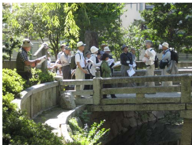
平成 23 年度子ども向け岡山後楽園ワークショップ 平成 23 年度第 3 回池田家文庫絵図をもって岡山を歩こう