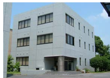
資源植物科学研究所分館

岡山大学附属図書館は、岡山市津島地区にある中央図書館と鹿田地区の鹿田分館、倉敷市にある資源植物科学研究所分館の3館で構成されています。各館のサービスはそれぞれのキャンパスや大学の枠を越え、地域や他の教育・研究機関等に、広く展開されています。市民に対するサービスとしては、学習を直接支援する資料閲覧等のほか、藩政史料を中心とした展示会やボランティア受入も定着しています。