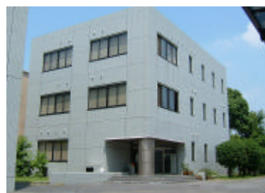
資源生物科学研究所分館

岡山大学附属図書館は、岡山市津島地区にある中央館と鹿田地区の鹿田分館、倉敷市にある資源生物科学研究所分館とで構成されています。各館のサービスはそれぞれのキャンパスや大学の枠を越え、地域や他の教育・研究機関等に、広く展開されています。市民に対するサービスとしては、学習を直接支援する資料閲覧等のほか、藩政史料を中心とした展示会やボランティア受入も定着しています。