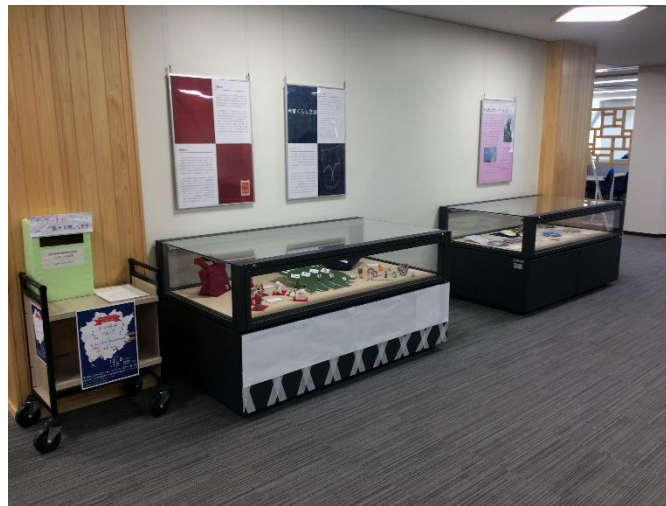
図2 第4回企画展「おかやまさんぽ」(2016年度)

あらゆる展示には、予算、資料、設備等、何らかの制約がつきものである。図書館での展示の場合、来場者はあくまでも図書館に来たついでであったり偶然であったりする 경우가ほとんどであろう。そうすると、せっかくの展示に対する反応に関し、アンケートを設置してもなかなか記入していただけない。そこでここ2年は、アンケートの体裁を工夫することで、少しでも気を引く努力を実習生は考案した。2019年度の場合、アンケート用紙を絵葉書風にし、かつ複数種類を用意し、それを郵便ポストにみたてた回収ボックスに投函いただく形をとった(図1写真の左手前)。その成果だろうか、以前は数枚しかなかった回収数が、ここ2年間は10枚前後と、僅かであるが増えている。また、会場があくまで図書館の一角であるため、博物館展示に通常必要な照明器具も存在しない。しかし、ある意味型にはまらない、自由な発想による展示にチャレンジしやすい環境でもある。2016年度に「倉敷」をテーマにした班は、展示ケース下部の黒い金属部分を白いマスキングテープと白用紙で飾り付け、白壁の蔵にみたてた(図2)。