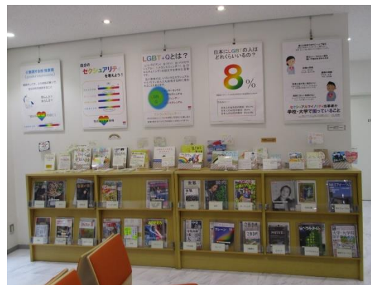
図書館での啓発パネル掲示と関連書籍紹介