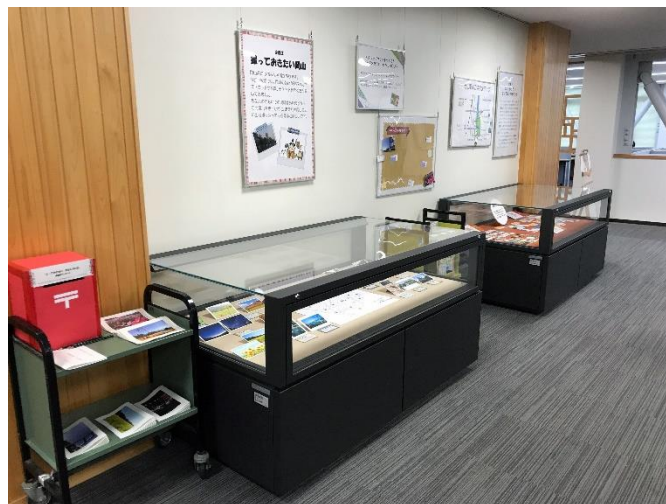
図1 完成した展示 (2019年度)

2つの展示ケースで実際に展示することとなったのは、企画1「とっておきたい とっておきのチケット」、企画2「撮っておきたい岡山」である（図1）。企画1では、大切に保管された博物館からコンサートに至るまで、デザインも発行方法も異なるチケットに着目した。企画2では、岡山の思い出の風景写真を絵葉書の形で表現した。統一展示名称については、第7回岡山大学文学部学芸員課程企画展「とっておきたい わたしの〇〇」とした。「わたしの〇〇」としたのは、来場者が主体的に想像しうる余地を残したいという実習生の意図による。また、できるだけ来場者に主体的に参加いただく仕掛けをつくるために、今回の場合、付箋を利用して思い出に関するスクラップブックをつくらう、というコーナーも中央に設置した。