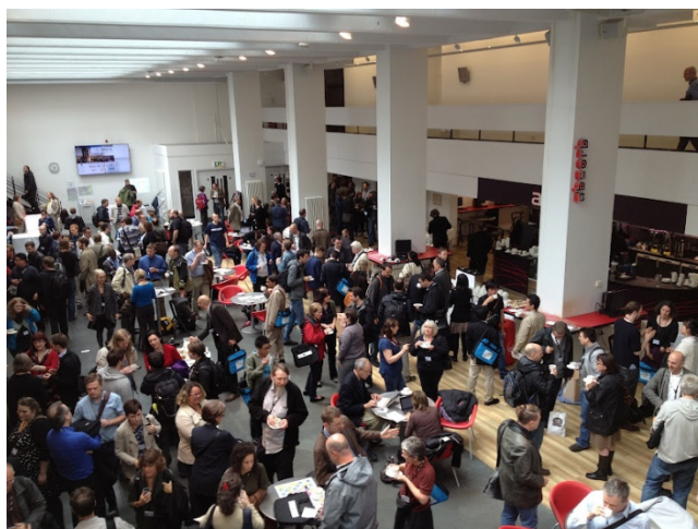
コーヒープレイク中も情報交換が活発

OR2012 の詳細についてはLiveBlog、Youtube 等で確認ができる。詳細はそちらを参照していただきたい。*3