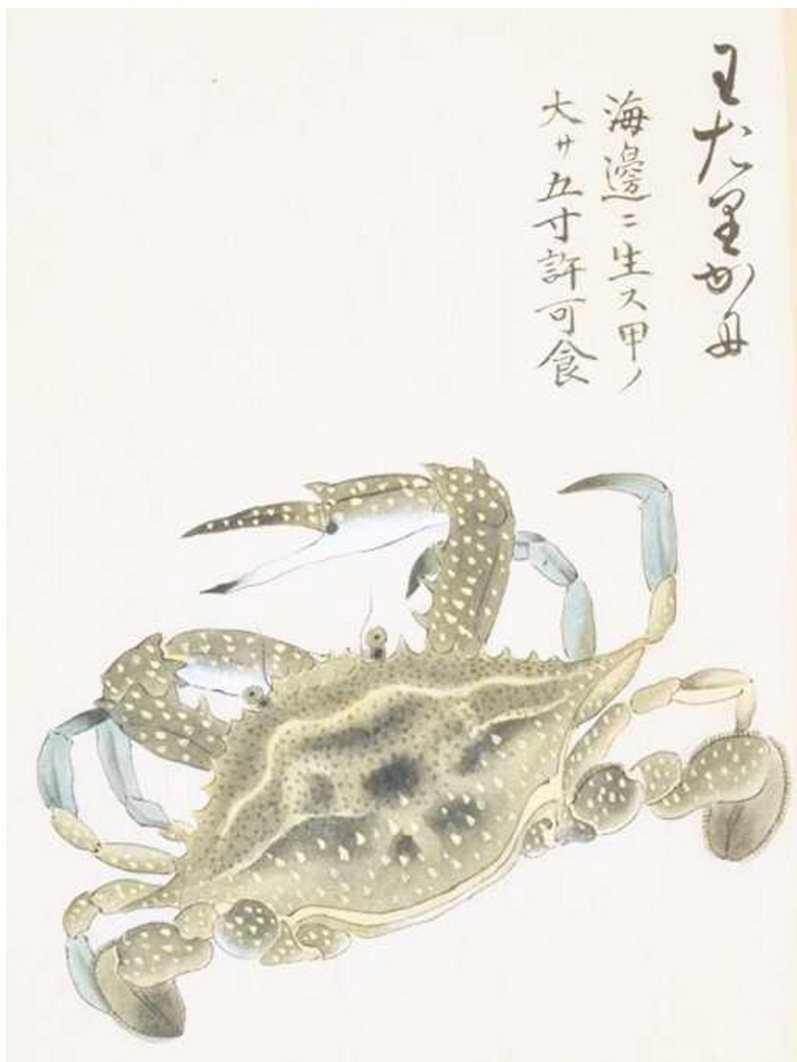
「備前国備中国之内領内産物絵図帳」（岡山大学附属図書館所蔵池田家文庫より）