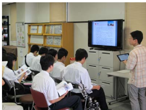
高校見学での活用の様子

46インチの大型テレビとiPadを、AppleTVを介して無線でつなげることで、ノートパソコンとプロジェクターの組み合わせよりも自由度の高い活用が出来るシステムになっています。プロジェクターの「周りが暗くないと見えない」「映し出すスペースが必要」という