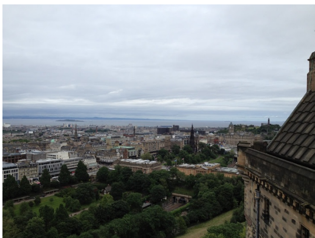
エジンバラ城から眺めた市街の風景

国立情報学研究所と Digital Repository Federation (国内の機関リポジトリ運営機関のコミュニティ、DRF) から Open Repositories 2012 (OR2012) に参加する機会をいただいた。OR2012 は機関リポジトリの開発、運用に携わる関係者が集まる国際会議で、7月9日 - 13日にエジンバラ大学で開催され、40カ国から約500名の参加者が集まった。私は、DRFの活動を紹介するポスター発表と、機関リポジトリの国際動向調査を目的