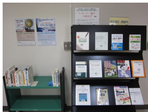
5月「論文・レポートの書き方」ミニ展示