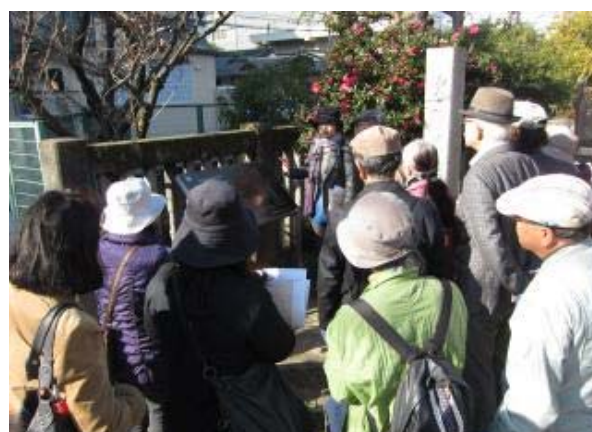
平成 26 年度池田家文庫絵図をもって岡山を歩こう