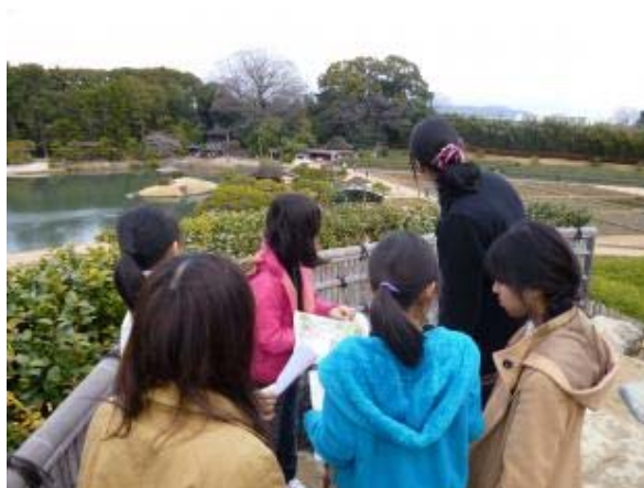
平成 26 年度子ども向け岡山後楽園ワークショップ