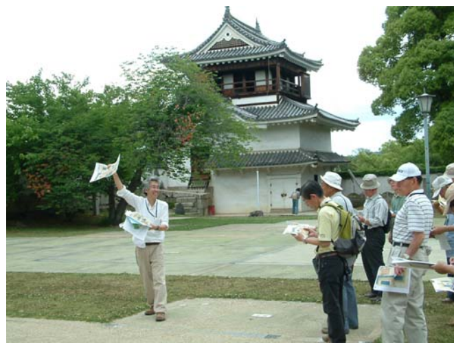
平成 22 年度子ども向け岡山後樂園ワークショップ 平成 21 年度第 2 回池田家文庫絵図をもって岡山を歩こう